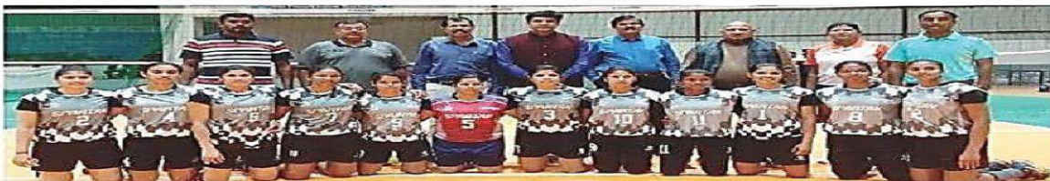
ମହାର ବିଜୟ ପରେ ଅତିଥିଙ୍କ ସହ ଓଡ଼ିଶା ମହିଳା ଭଲିବଲ୍ ଦଳ